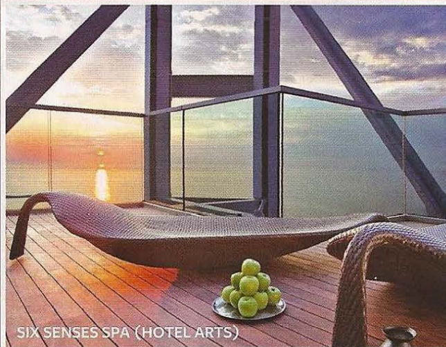
SIX SENSES SPA (HOTEL ARTS)